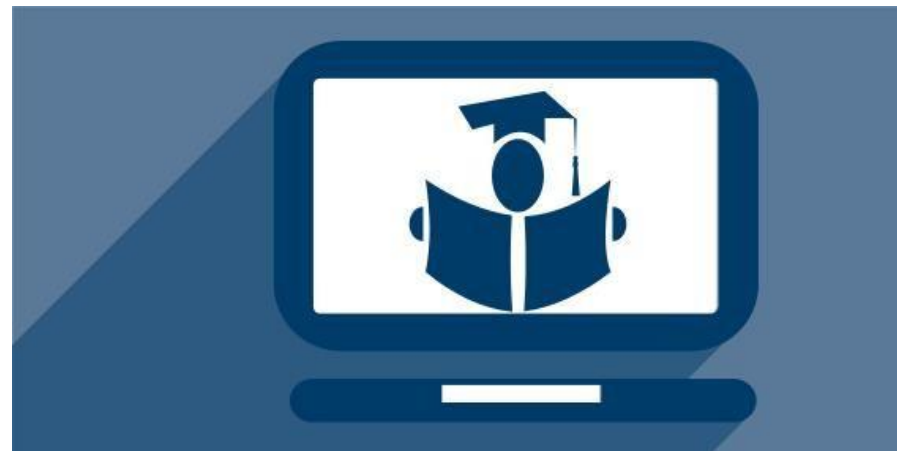
План-график изучения дисциплины «Методика преподавания естествознания» (маршрутный лист)