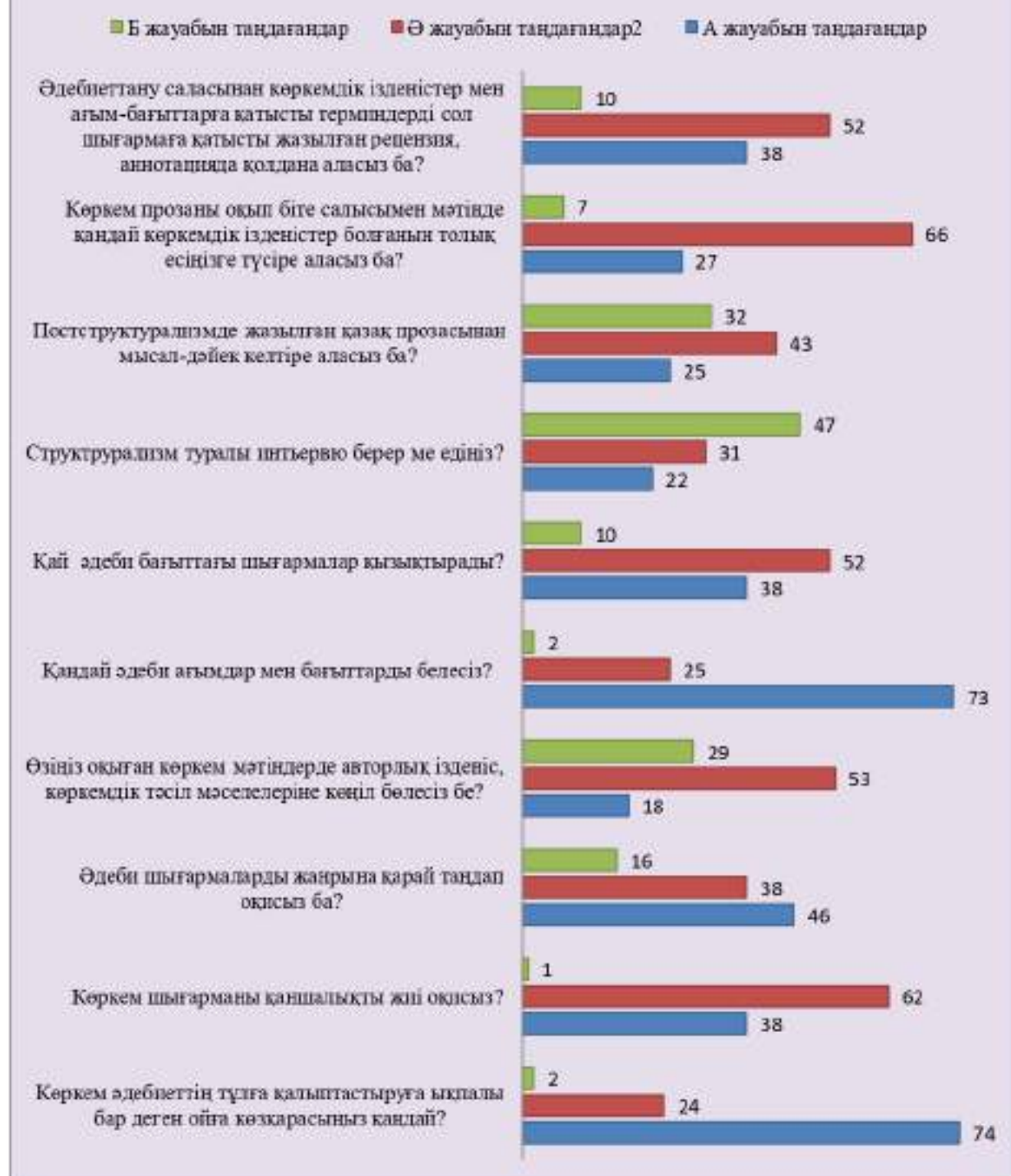
Сурет 5 – 2 сауалнама қорытындысы

Эксперименттің алғашқы кезеңінде сауалнамамен қатар тест тапсырмалары, талдау жұмыстары, пікір алысу жұмыстары да ұйымдастырылды ( Қосымша 3 ).