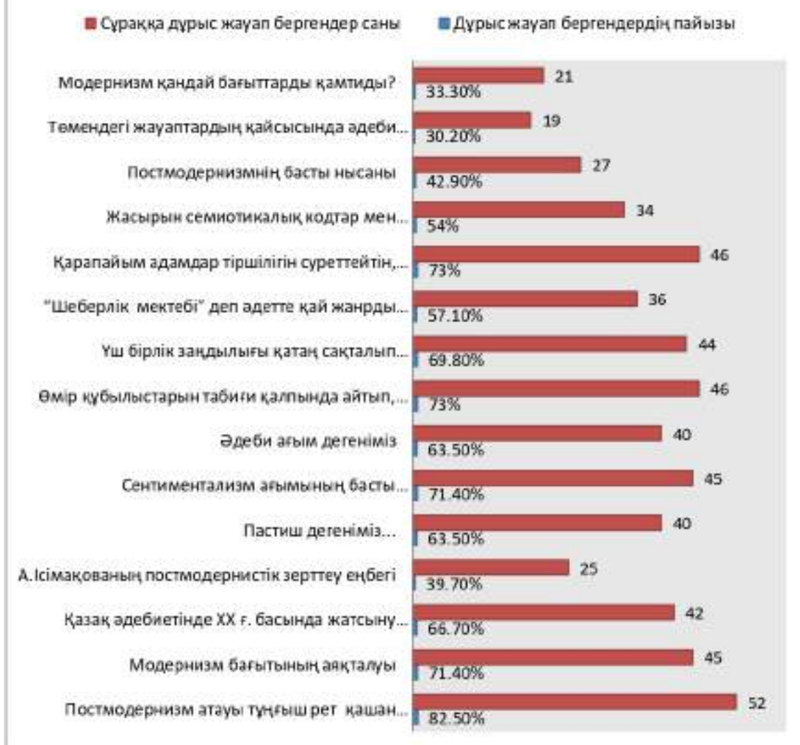
Сурет 8 - Тест нәтижелері.

Жүргізілген эксперименттік-байқау жұмысынан кейін бақылау тобы мен эксперимент топтың көрсеткіштері салыстырылды. Жүргізілген тәжірибе жұмыстарының (оқу-таным үдерісіндегі сұрақтарға жауабы, топтық жұмыстағы пікірлері, топтық диалогтегі белсенділігі, пікір қорғауы, өздік жұмыстарының нәтижелері т.б.) Тәжірибеге қатысқан бақылау тобы мен эксперимент тобындағы нәтижелер анықталды.