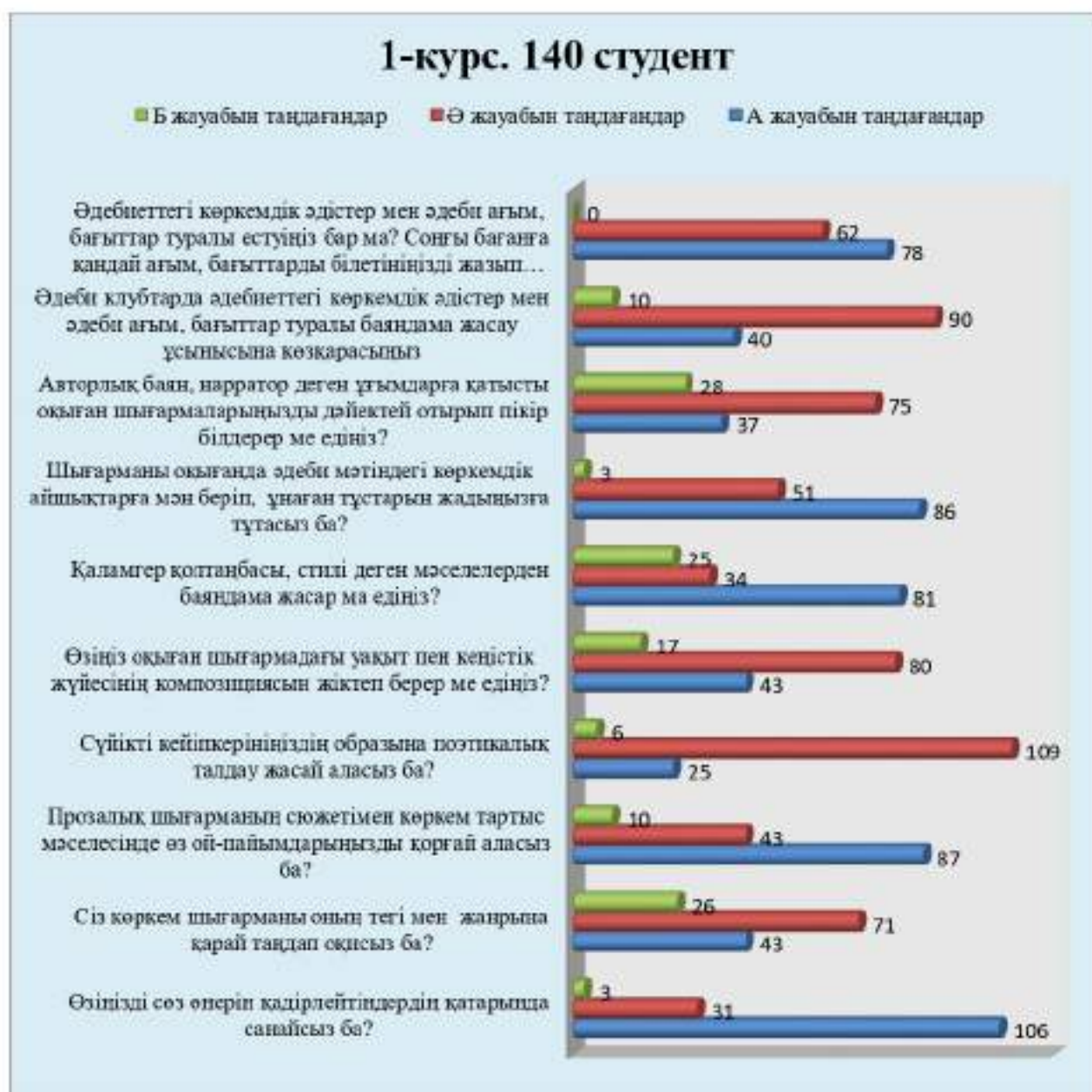
Сурет 4 - 1-сауалнама қорытындысы

Жиналған баллдың жалпы суммасы студенттердің көркем шығарма оқуға деген қызығушылығы мен әдеби-теориялық алғашқы білім деңгейлерін байқатты.