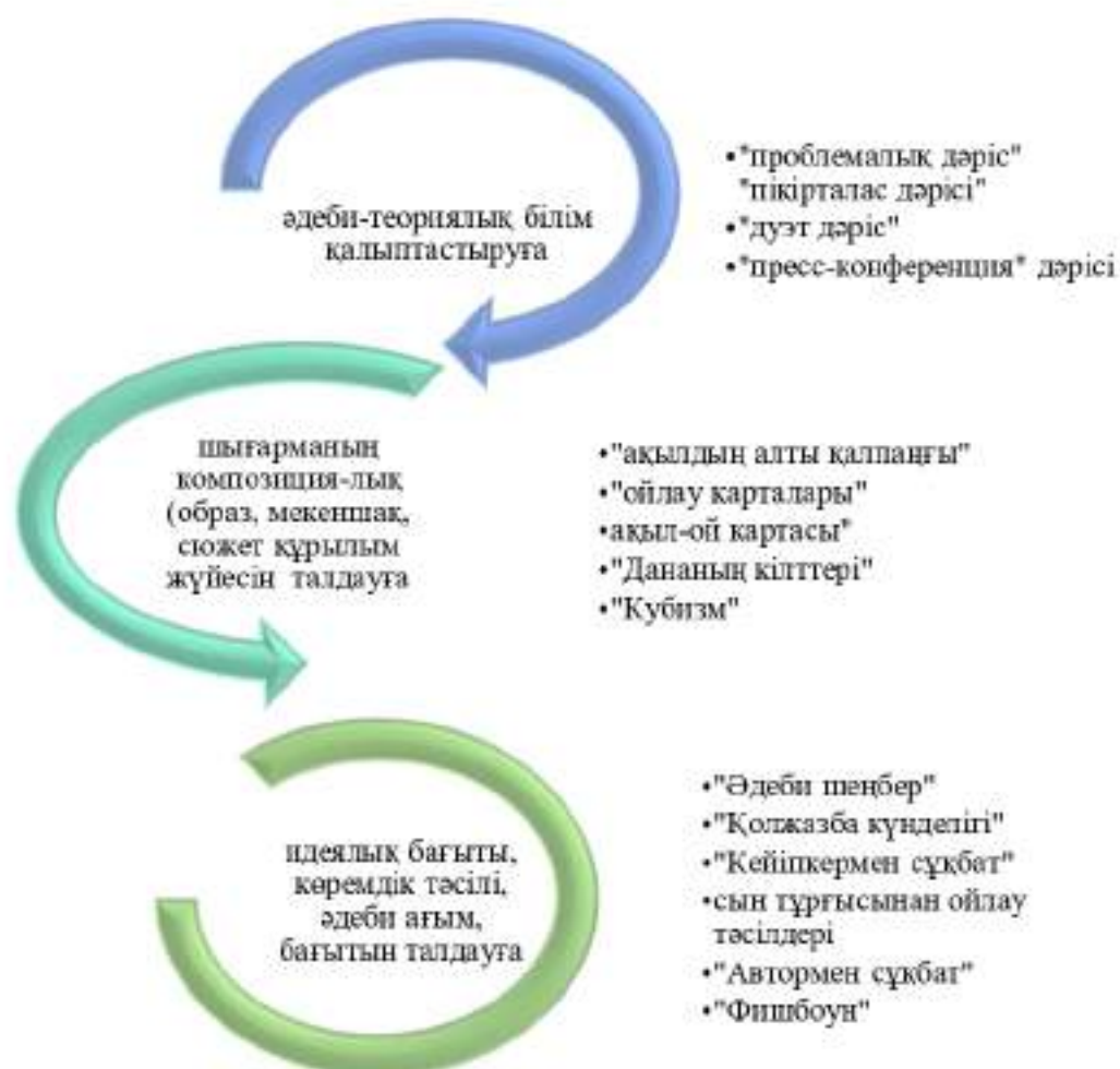
Сурет 2 - «Қазақ прозасындағы көркемдік ізденістер мен ағымдар» курсының оқыту әдіс-тәсілдері

«Қазақ прозасындағы көркемдік ізденістер мен ағымдар» курсы бойынша берілетін білімнің өзегінде көркем прозалардың әдеби үдерістегі даму бағытын айқындау, ондағы соны ізденістерге, көркемдік таным арналарына кешенді талдау жұмыстарын жүргізу қажет. Осы орайда бірқатар шығармаларды оқып талдау өздік жұмыстарының үлесіне тимек.