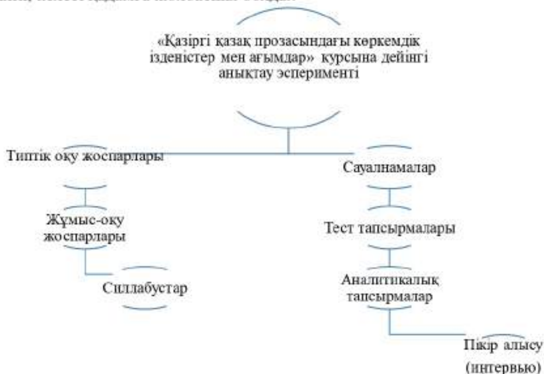
Сурет 3 - Анықтау экспериментінің бағыт-бағдары

Анықтау экспериментінің бағыт-бағдары мынадай нысандар негізінде жүргізіліп, келесі қадамға жолбасшы болды: