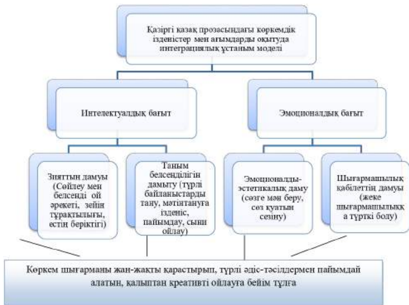
Сурет 1 - Қазіргі қазақ прозасындағы көркемдік ізденістер мен ағымдарды оқытуда интеграциялық ұстаным моделі

Арнайы педагогикалық, психологиялық зерттеулердің негізінде және оқуды іске асырудың ұзақ жылдардағы тәжірибе нәтижесінде өзінің тиімді екендігін әбден дәлелдеген ұстаным – көрнекілік . Білім берудің әдіс-тәсілдерінде көрініс табатын көрнекілік ұстанымы студенттің ақпаратты қабылдауын толыққанды ету мақсатынан туындайды. Сөйлеу әрекеттеріне негізделетін әдістер ассоциативті-абстрактілі ойлауға ықпалы басым. Ал көрнекілік оқу материалын түсіну жолдарын оңтайландырады, эмотивті тұрақтылығын қамтамасыз етеді. Мысалға, неғұрлым оқу материалдарын сезім құралдарын белсенді қатыстыра қабылдау болса, соғұрлым ол берік есте қалады, жете меңгеріледі. Бұл ғылыми тұжырымның күмән туғызбайтынын Я.А.Коменский, К.Д.Ушинский, И.Г.Песталотий бастаған, Л.В.Занков, А.И.Зильберштейн, О.М.Ясько қостаған педагог-әдіскерлер растайды. Көрнекі құралдар жіктелесінде табиғи, эксперименттік, көлемдік көрнекілік, бейнелеуші көрнекілік, техникалық, символды, графикалық деген түрлері бар. Бүгінде көрнекіліктер мульти-медиялық құралдар, түрлі гаджеттер арқылы да толығын отыр. Ақпараттың шектен тыс молаюы қабылдауды да күрделендіре